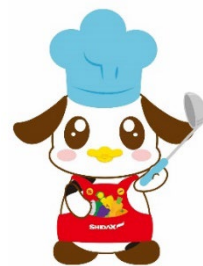
シダックスグループ公式 食育キャラクター「モグちゃん」